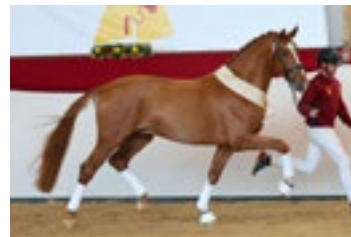
De Dembélé Körnung München