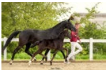
Hengstfohlen v. Iowa Gold