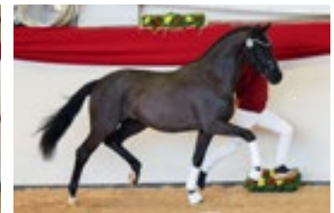
Total Love Körnung München