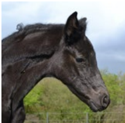
Stutfohlen v. Destello