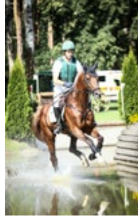
Arion H Bundeschampionat