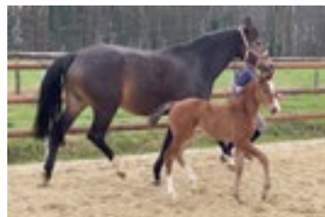
Stutfohlen v. Ventura