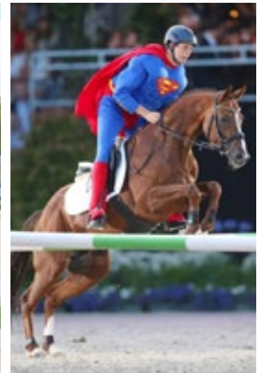
Asagao xx Showbild Aachen