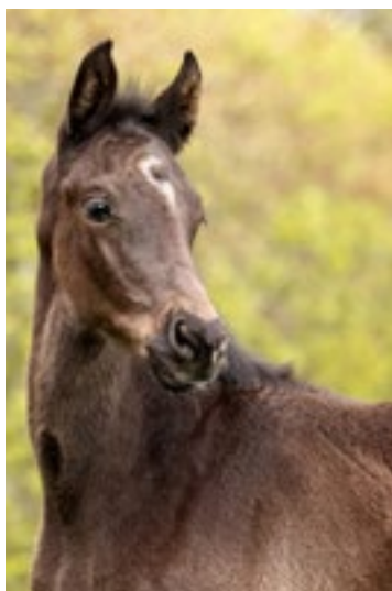
Hengstfohlen v. Zuperman