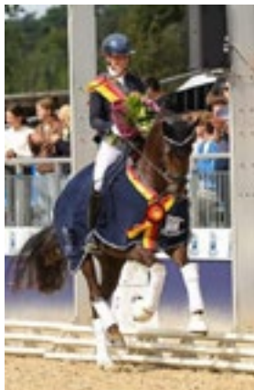
Bundeschampionesse v. Bonds